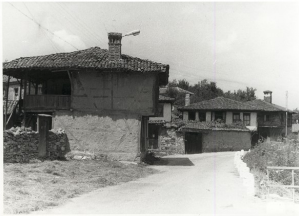
КЪЩАТА НА БОЖКО ЙОНОВ /ДАДИНАТА КЪЩА/

Документирането извършено от екип на НИПК/НИНКН за ансамбъла, а и за цялото с. Свежен е на много добро ниво. Голяма част от материалите са подготвени от арх. Елена Конярска, като много малко остават обектите без направено типологично архитектурно заснемане и архивна фотография от периода на 70-те и 80-те години на ХХ-ти век. За всеки обект е подготвено досие с описание, чертежи и фотографии, по-важните къщи в ансамбъла са допълнени с подробни фотографии на детайли. Прави впечатление, че почти изцяло липсват архивни фотографии на интериорите на сградите, но те са подробно описани, което позволява актуална оценка за тяхната съхраненост. Единствените обекти от ансамбъл „Долни край“, за които не са открити архивни архитектурни заснемания в архива са номера 12, 19, 23. Изключително ценни са заснеманията на вече изчезнали сгради, тъй като дават информация за обекти, които вече не могат да бъдат документирани – такива номера – 5, 11, 15