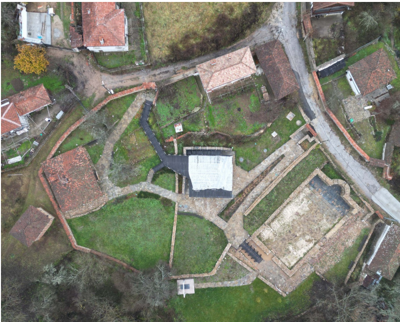
„Двор с оградни зидове на старата църква „Св. Георги“, пл. № 141, обявен в ДВ бр. 86 от 1986 г.