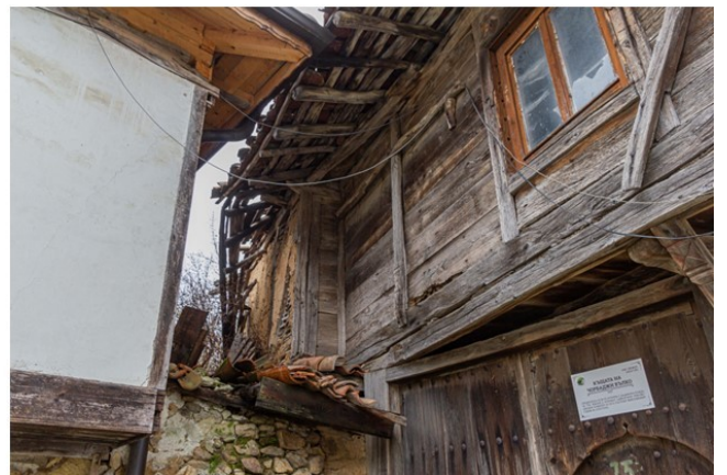
Къща на чорбаджи Вълко /Вълко Славов Вълков/ в която е отсядал Левски /собственост на наследници на Вълко Славов/