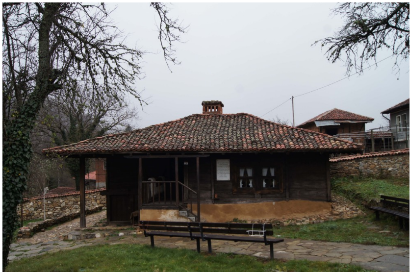
Къща на Полковник Серафимов