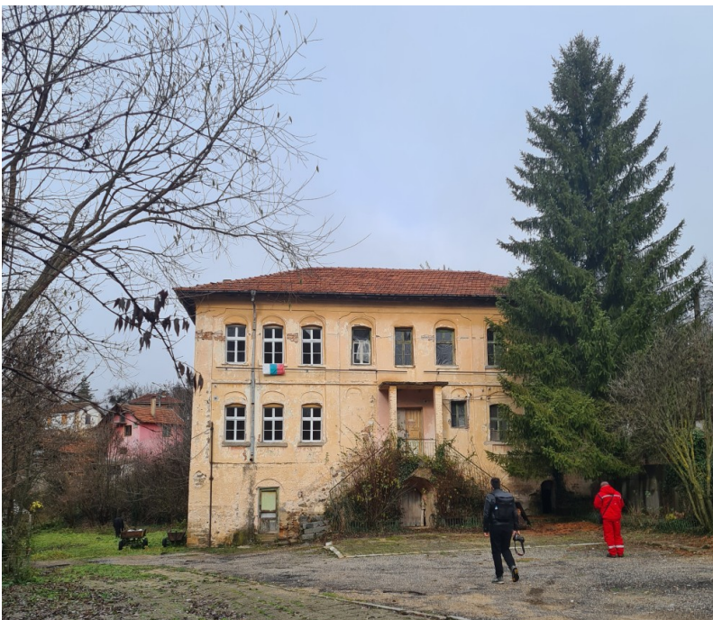
Училищна сграда от 1880 година