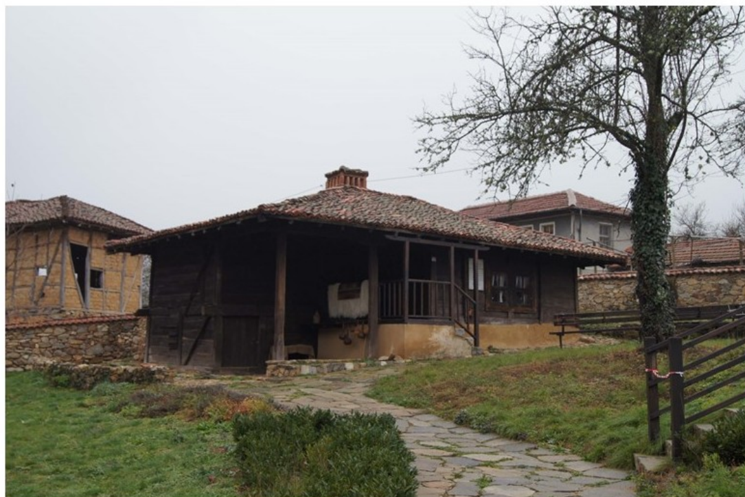
„Къща на полковник Серафимов – собственост на Роза К. Серафимова“